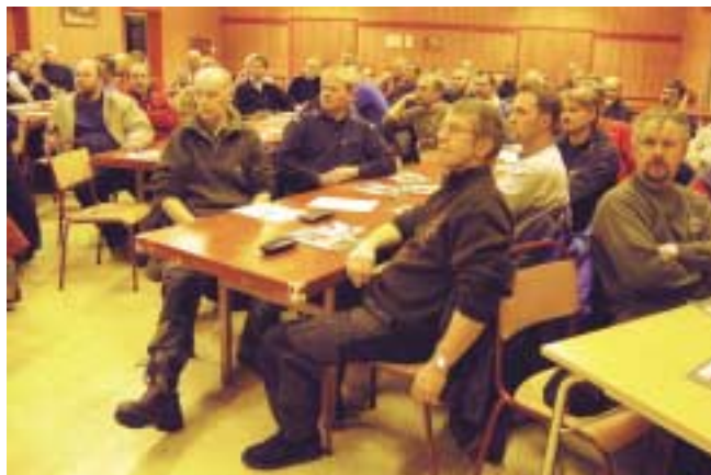
Stor interesse for ulvejaktkurs. Bildet viser noen av de over 60 deltagere som møtte i Trysil 30. januar.

Trysil, Aremark og Aurskog-Høland har hatt besøk av Folkeaksjonens kurs. Etter at det foreløpig siste kurset er gjennomført i Elverum 8. mars har 200 personer deltatt.