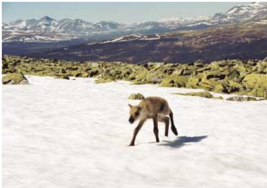
Norge har et helt spesielt ansvar for villreinen i Europa

Samfunnsforskningen har vist at tillit mellom ulike aktørgrupper er et kjernepunkt i rovviltforvaltningen. I dag eksisterer nesten ikke denne tilliten, dette bidrar sterkt til å forsterke konflikten. Vi som har røtter i det lokale miljøet, opplever at såkalt nøytral forskningsbasert informasjon om rovdvirs adferd, antall, levedyktighet etc etc, svært ofte avviker sterkt fra den erfaringsbaserte kunnskap. Dette er kunnskap som kan strekke seg over mange 10-år og med hundrevis av feltdager og tusenvis av felttimer. Dette blir sammenlignet med forskningens fåtall av år i et prosjekt, som kanskje uten å sette sine bein i vesentlige konfliktområder flagger sine akademiske og sylskarpe konklusjoner. Som etter noen år faller i knas av ny forskning eller av praktisk erfaring. Hvor lenge har vi forsket på rype i dette landet? Ca 80 år, men ingen kan enda dokumentere hvorfor bestanden svinger så mye. Er det lov å minne om at rovviltforskningen i Norge er fersk og uten