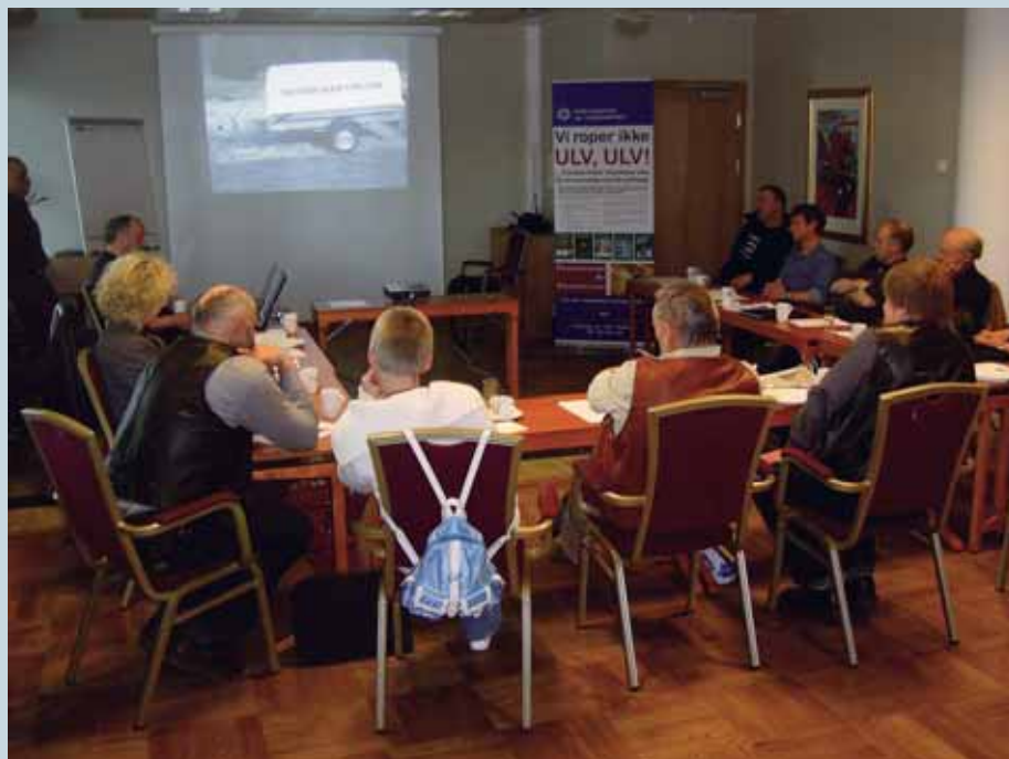
Lokallagsledere og tillitsvalgte studerer og diskuterer profileringsmateriell for Folkeaksjonen.

Organisasjonsarbeid og profileringsmateriell var viktigste tema i tillegg til politiske diskusjoner og sosialt samvær. Samtidig med samlingen var det Villmarksmesse på Lillestrøm, der deltagerne fikk anledning til å praktisere verving og møte med publikum lørdag ettermiddag.