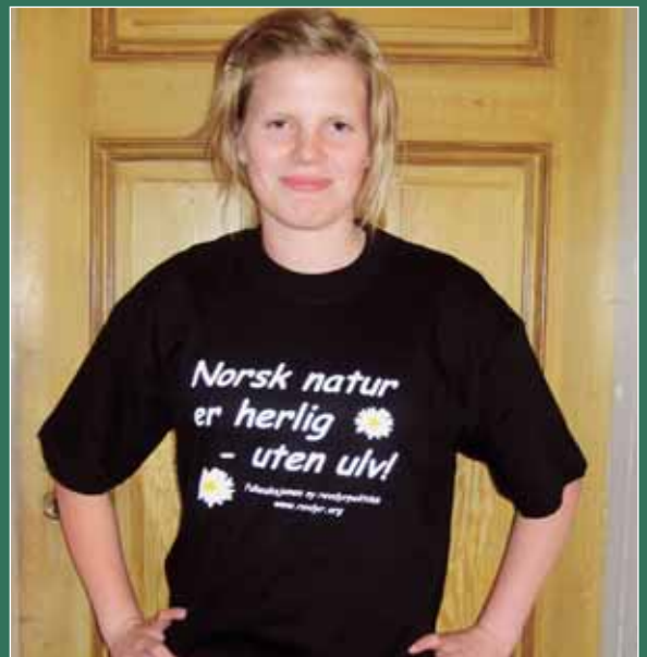
Folkeaksjonens T-skjorte finnes i sort farge i størrelse M – L – XL og XXL.

Folkeaksjonen ny rovdyrpolitikk leverer også daglig nyheter til www.rovviltportalen.no , Direktoratet for naturforvaltnings nye portal for norsk rovdyrforvaltning. Nye medlemmer kan selvsagt melde seg inn via www.rovdyr.org , og her kan du også bestille Folkeaksjonens T-skjorte «Norsk natur er herlig – uten ulv» for kroner 100 pr. stk + frakt. Du kan også bruke bestillingskupongen på side 12 inne i dette bladet.