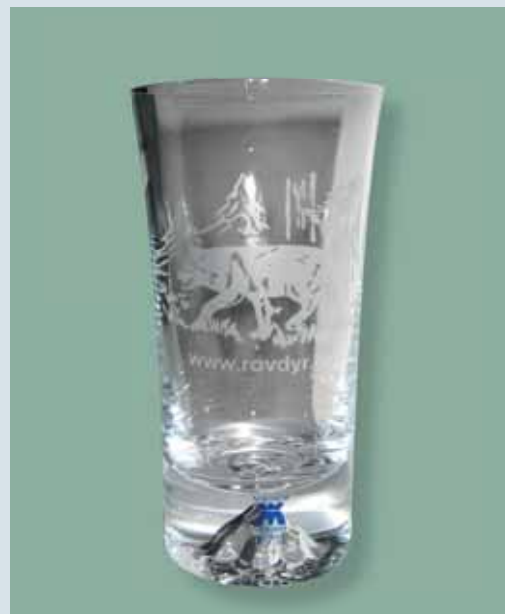
Folkeaksjonens ulveglass. Høyde 12 cm.

Verver du 6 nye medlemmer får du i tillegg et flott ulveglass fra Magnor Glassverk, spesiallaget for Folkeaksjonen ny rovdyrpolitikk