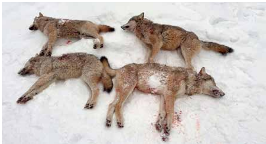
Ulvåaulver: Disse ulvene ble felt i løpet av 13 minutter av lisensjegerne i Ulvåareviret 10. februar i år.

Så langt er dette en gjentakelse av forrige års juridiske kamp om lisensfelling i ulvesona. Også i januar 2022 forbød Oslo tingrett iverksettelse av lisensfelling, den gang etter krav fra dyrerettighetsorganisasjonen Noah. I fjor endte den juridiske revirkampen 11. februar, fire dager før jakttidens slutt, med en kjennelse fra Borgarting lagmannsrett om at tingretten tok feil og at vedtaket om lisensfelling var gyldig. I løpet av tre korte jakt dager i fjor ble det felt 11 ulver og deler av gjenstående kvote ble i dagene som fulgte felt av Statens naturoppsyn som ekstraordinære uttak.