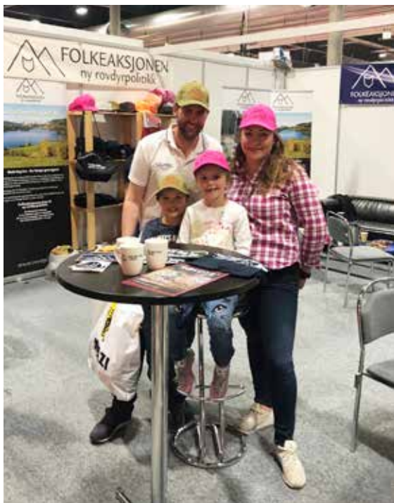
FNR på stand på Camp Villmark