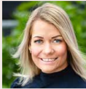
Landbruksminister: Sandra Borch (Sp).

– Jeg skjønner godt at situasjonen for beitebrukerne i Ulvådalen er veldig krevende. Det