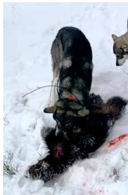
Jakt: Hunden Hero med en jerv som er felt i Tynset i vinter.

– De vokser ikke på trær, disse hundene. Det ligger mye arbeid bak en sann hund og å få den til å konse på riktig dyr.