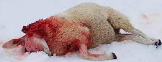
Jerveskade: Dette lammet ble funnet av turgåere i juli 2022 mens jerven fortsatt var i området.