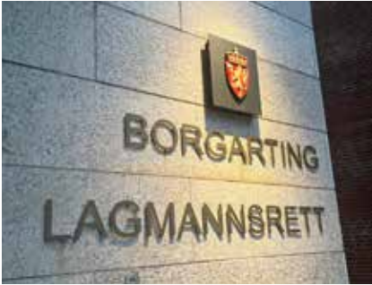
Lagmannsrett: Dommere i Borgarting lagmannsrett har åpnet for lisensfelling i ulvesona to år på rad.