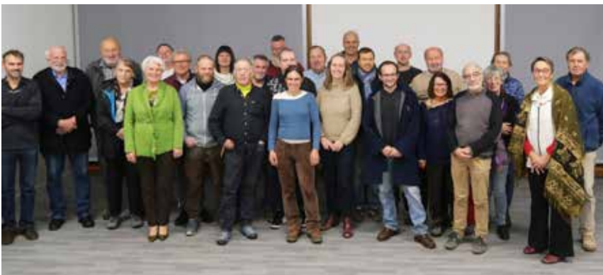
Europeisk samling: Deltagere fra elleve europeiske land var representert under møtet til L'union européenne des éleveurs.

Vi ber deg om å lytte til oss, forstå hva det er som er i ferd med å skje og å reagere!