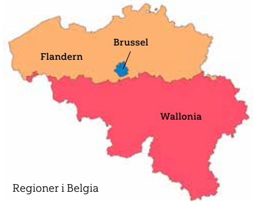
Regioner i Belgia

I Nederland har veterinærer skrevet et felles brev til regjeringen med krav om at det skal iverksettes tiltak for å stoppe blodbadet og at de ikke ønsker å se flere skadde og lemleste husdyr.