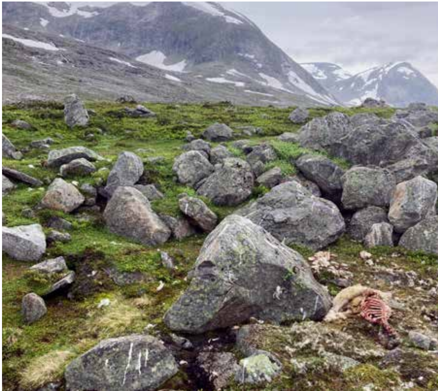
Fjellområder: Typiske funnsteder for jervetatte lam i Ulvådalen.