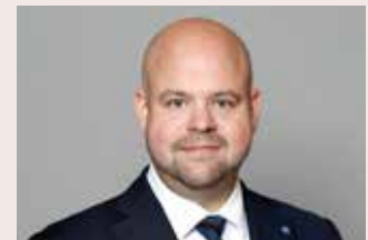
Landsbygdsmister: Peter Kullgren.

– Regjeringen vurderer derfor at det aller høyeste vernnivået for ulv ikke er forsvarlig for Sverige. Ulven må fortsatt beskyttes, men ikke på det aller høyeste beskyttelsesnivået.