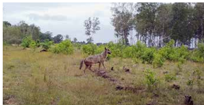
Noëlla: Ei ulvetispe, som på folkemunne omtales som Nöella, etablerte seg nord i Belgia i 2020. Det ble starten på Limburg-reviret.