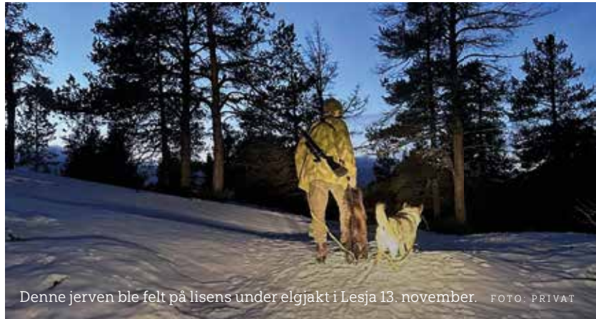
Denne jerven ble felt på lisens under elgjakt i Lesja 13. november.

– Ei jente på laget fikk den på post, men fikk ikke løsnet skudd. Deretter sprang den nedover noen meter foran bilen hennes og bortover skogen. Så hentet hun en hund i bilen og begynte å spore. Kort tid etter kom jerven i ganske god fart rett mot faren min der han satt på post, hvor den ble felt på 15 meters hold. Det er en ganske utypisk oppførsel av en jerv å være så lite sky, sier Sæther.