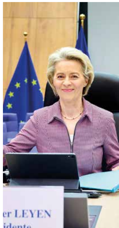
Ursula von der Leyen er president for EU-kommisjonen som nå har gått ett steg videre med forslaget om å endre ulvens vernestatus.

Reaksjonene på EU-kommisjonens forslag er kraftige fra ulveentusiaster over hele Europa, mens andre som Svenska Jägareförbundet ser en åpning for det de mener er en bedre ulveforvaltning i EU.