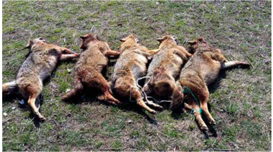
OVER: De tre siste årene er rundt 36 000 gullsjakaler felt i Georgia.

Et tiltak er å opprette en spesialoppnevnt jegergruppe på 200 skyttere, som jobber