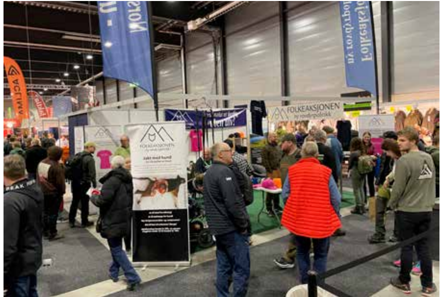
FNR på Camp Villmark i 2023.