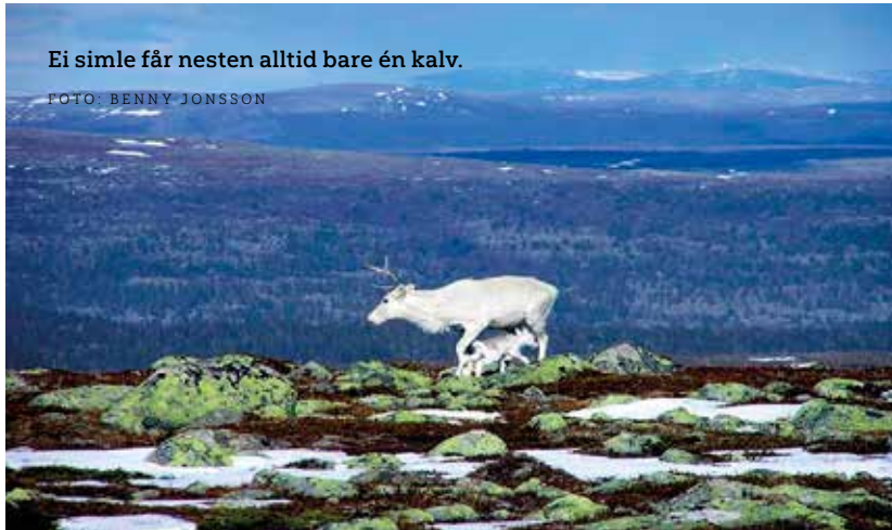
Ei simle får nesten alltid bare én kalv.