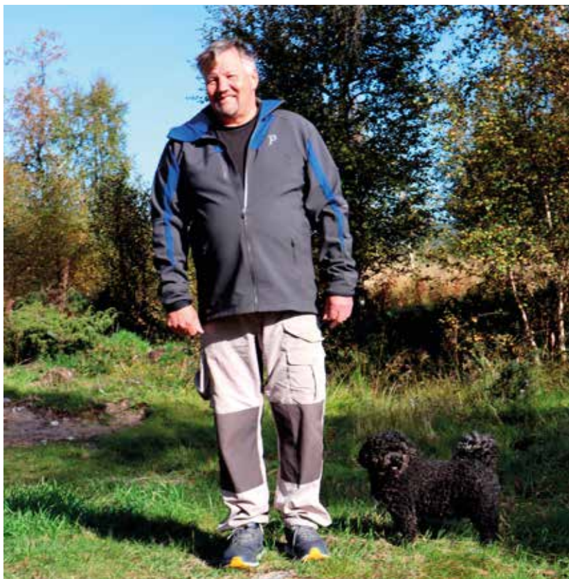
En liten hund, som denne dvergpuddelen, er en god gjeterhund i kalvingstida. Større hunder løper raskere og kan forstyrre kalver som ikke er mer enn noen dager eller uker gamle.