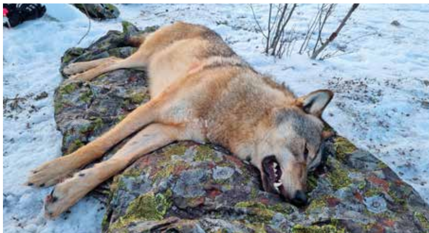
Hannulven V1157 ble bedøvet og påsatt GPS-halsbånd i midten av desember