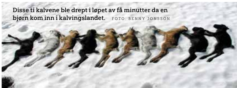
Disse ti kalvene ble drept i løpet av få minutter da en bjørn kom inn i kalvingslandet.