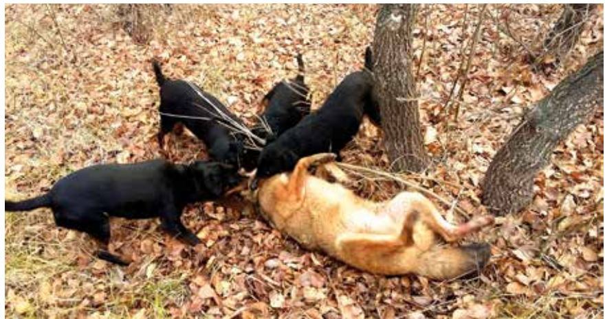
UNDER: Hunder under jakt på gullsjakal.

spesifikt med å stanse spredningen av ulv og gullsjakal. Etter den delvis svenskfinansierte kartleggingen har jakten kommet i gang, og de siste tre årene er det skutt 1200 ulver og 36 000 gullsjakaler under offisiell jakt. Jakten starter første november og varer hele vinteren til siste mars. Alle regioner og byer har fått kvoter på hvor mange ulver de må fjerne. Totalt skal minst 256 ulver skytes i vinter. Det er enkelt å få tillatelse til å skyte mer for de som ønsker det. Et enkelt brev til myndighetene er alt som trengs.