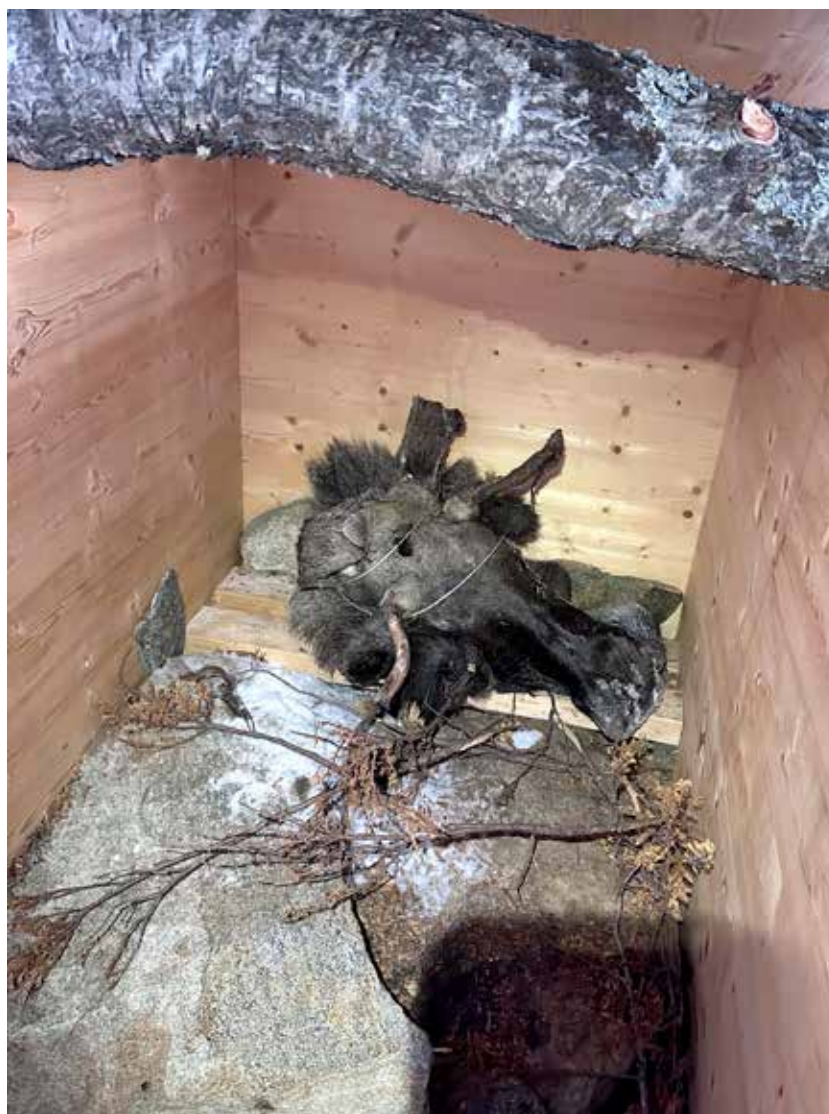
INNI BÅSEN: Et elghode fungerer som åte. Tråder rundt åtet aktiverer utløsermekanismen når jerven begynner flytte på åtet.