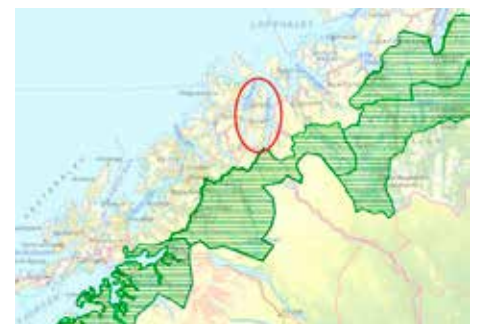
Til høyre: Lyngenhalvøya (markert med rødt) ligger utenfor det gaupeprioriterte området i Troms (markert med grønt).