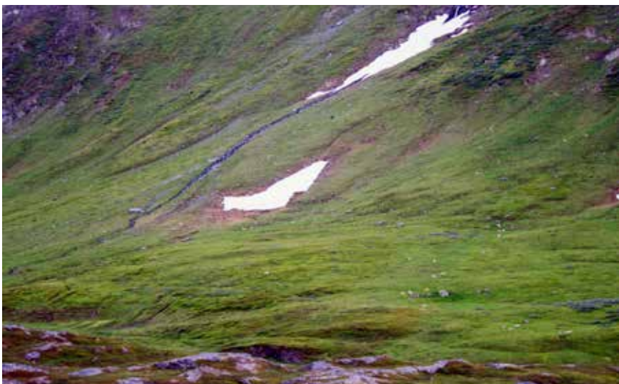
Beitene i Lyngen er noen av de mest næringsrike i Norge.

– Vi legger ned så mye innsats i å drive effektivt og med god avl og dyrevelferd. Streifdyr av gaupe er det fra tid til annen, men slik det er nå har ikke gaupa nok naturlig føde her. Staten avler opp rovdryr som må spise tamdyr. Det kan verken jeg eller andre dyreeiere godta, sier Fossmo.