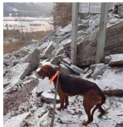
Whisky er en støverblending, også han fra Sverige.

I vinter åpnet Klima- og miljødepartementet opp for at denne typen hunder kunne benyttes under lisensfelling av ulv i Nord-Østerdalen for å trene opp hunder til bruk under skadefelling i beitesesongen. Denne muligheten har hundeførere i området kunnet benytte seg av ved en håndfull anledninger. Steigen håper dispensasjonen fra i vinter,