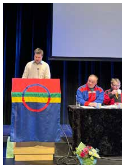
Landbruksminister Geir Pollestad ble dynget ned med spørsmål fra salen.

Tidligere utgaver av magasinet du nå leser har beskrevet hendelsesforløpet som førte fram til bjørneskuddene inngående, og alt dette stoffet er tilgjengelig på nettsiden Rovdyr.org.