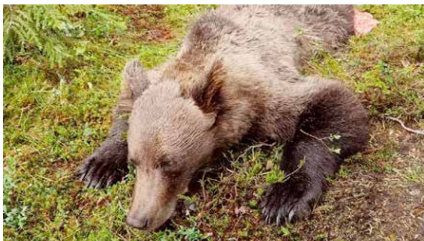
Denne bjørnen ble felt i Rollag i fjor sommer.