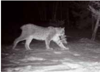
Bilder av gauper nær bebyggelse er blitt en del av hverdagen for sauebønder i Lyngen.

En sporrekke fra ei gaupe som går rett inn i saueflokken er et urovekkende syn for en dyreeier.