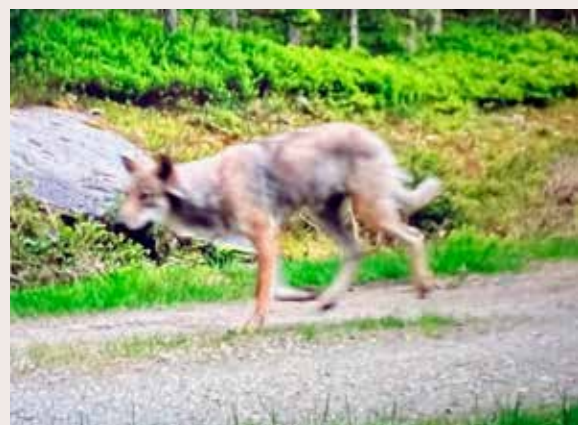
Denne ulven ble fanget opp av et viltkamera i Eidsvoll kommune 31. mai.