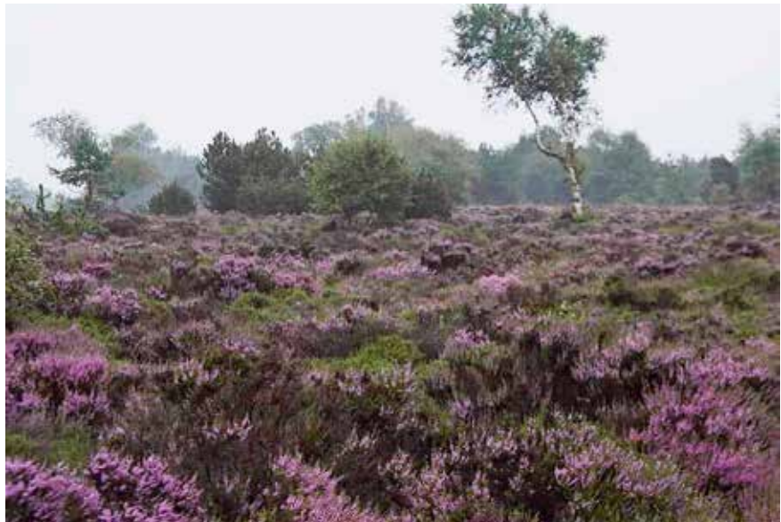
Åpent lavland preger det danske landskapet. Her Nørholm Hede.