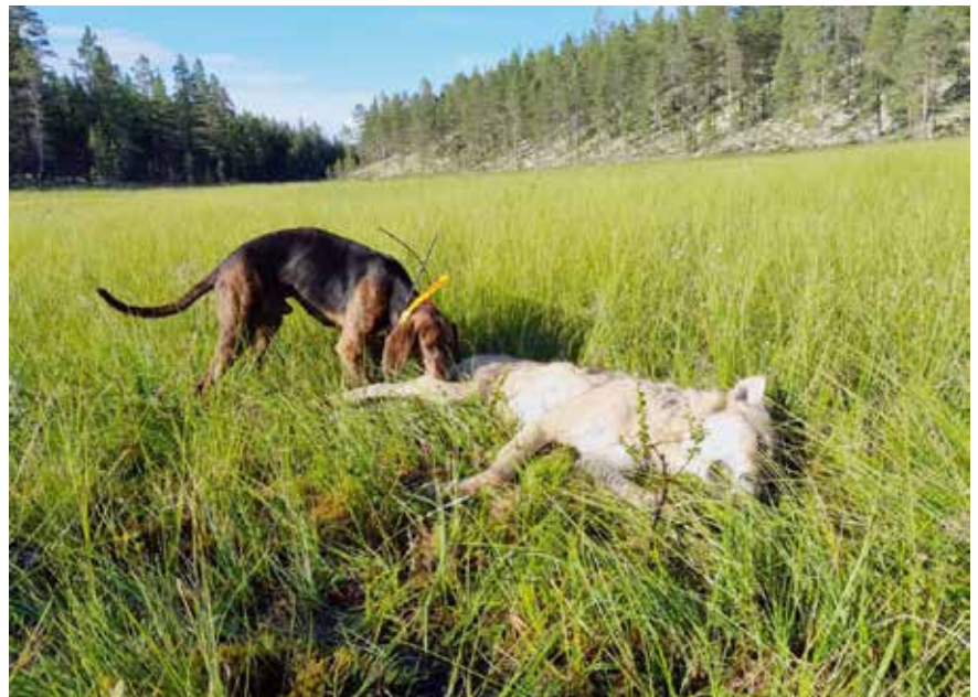
Whisky med en ulv som ble felt i Alvdal i 2023.

En ulv kan dukke opp brått fra ingen steder. Da gjelder det å være forberedt. En kort og effektiv operasjon er definitivt å foretrekke. Før eller siden kommer hunden og ulven til å møtes før eller senere. Da kan det bli stålos eller ganglos, eller ulven kan snu jage vekk hunden. Hvis ulven har fått flere erfaringer med hund, ser den